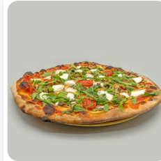
Pizza Bufalota amb ruca, búfala, xampinyons, tòfona negra, oli de tòfona i tomàquet cherry de Viladecans.