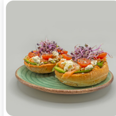
Torrada d'alvocat, salmó, formatge feta i tomàquet cherry de Viladecans.