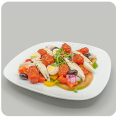
Amanida de seitons amb tomàquet cherry de Viladecans confitat.