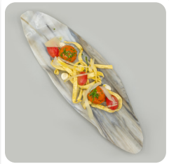
Pasta napolitana fregida amb tomàquets cherry de Viladecans farcits de pesto.