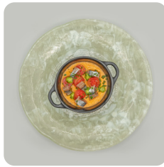
Iogurt de tomàquet amb sardina fumada, alfàbrega i tomàquet cherry de Viladecans.