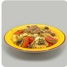
Fusilli, tonyina, formatge de cabra, tomàquet cherry de Viladecans, olives negres i oli d'alfàbrega.