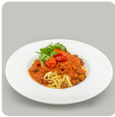
Tallarines amb putanesca de tomàquet cherry de Viladecans.