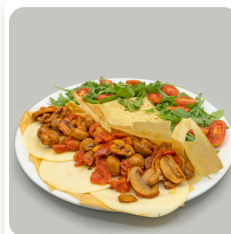
Crep farcit de xampinyons, tomàquet cherry de Viladecans caramelitzat i mozzarella.