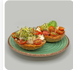
Bruschetta by Leben amb tomàquet cherry de Viladecans.