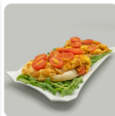
"Mollete" d'Antequera amb truita als quatre formatges, tomàquet cherry de Viladecans caramelitzat i cruixent de ceba.